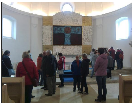
Foto kostela sv. Petra a Pavla v Jedovnici navštíveného v rámci letošní „farní pouť“.