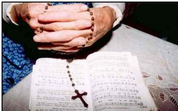
upravil o. Josef

Rada pro začátečníky: Lepší jeden desátek před spaním než celý růženec ve spánku!