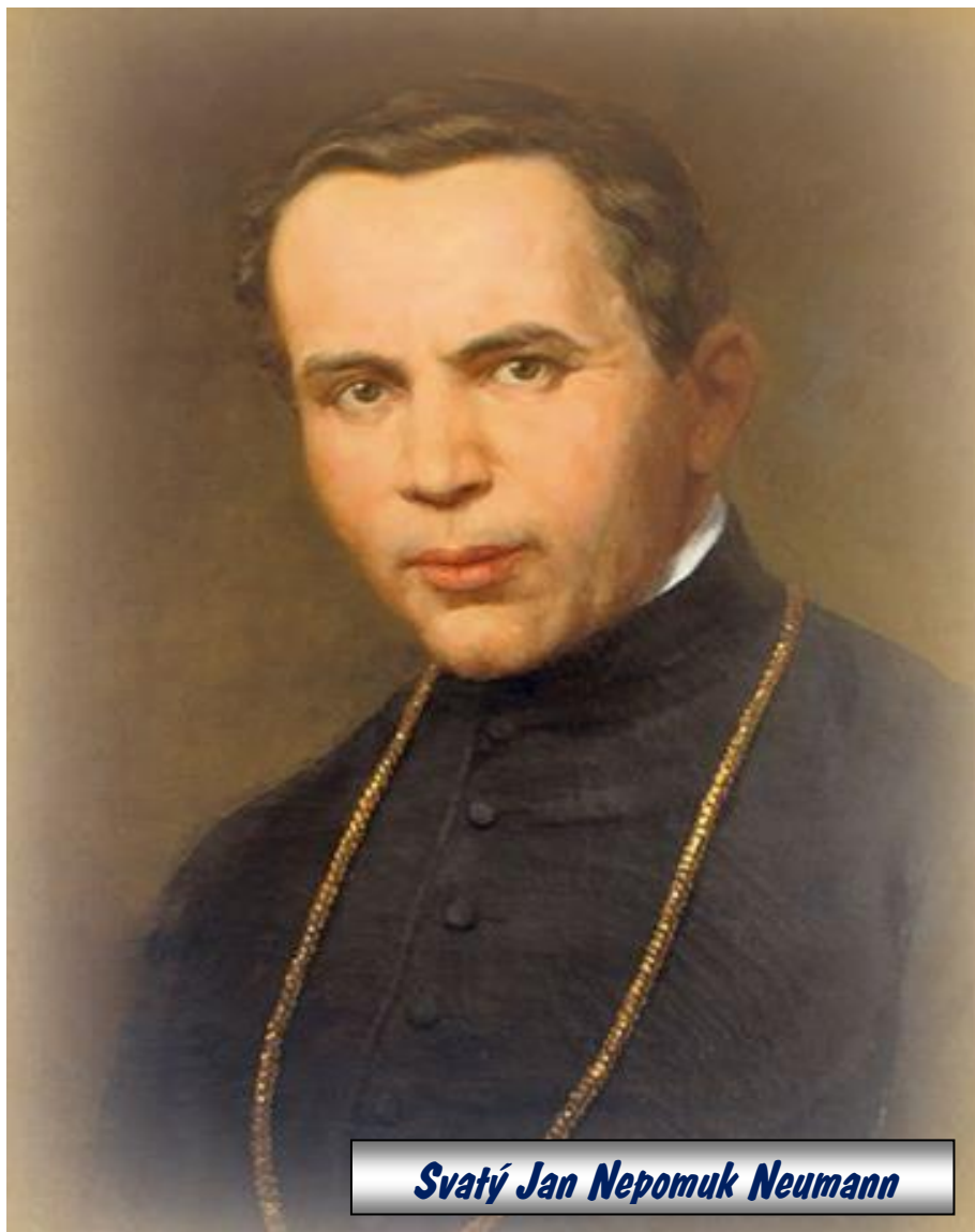
Svatý Jan Nepomuk Neumann