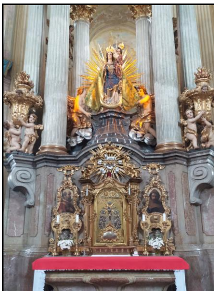
Barokní chrám Panny Marie Nanebevzaté - Křtiny