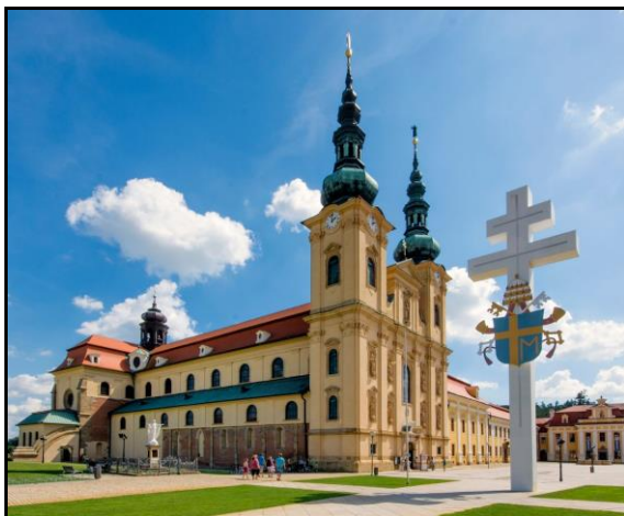
Svatí Cyril a Metoděj – Velehradská bazilika