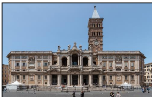
Římská bazilika Santa Maria Maggiore zasvěcená Panně Marii Sněžné.