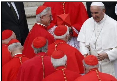
Papež František jmenuje dne 29. června 14 nových kardinálů.

Kardinálové tvoří elitu katolických duchovních, jsou považováni za nejbližší poradce papeže. Jsou-li mladší 80 let, mohou se stát členy takzvané konkláve, sboru pro papežskou volbu. Mezi novými 14 kardinály se to týká jedenácti z nich. Jedenaosmdesátiletý František je prvním papežem pocházejícím z Latinské Ameriky. Od svého jmenování v roce 2013 dosud obdařil kardinálským titulem už 60 duchovních.