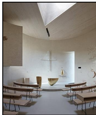
EXTERIÉR A INTERIÉR KOSTELA SVATÉHO VÁCLAVA V SAZOVICÍCH U ZLÍNA