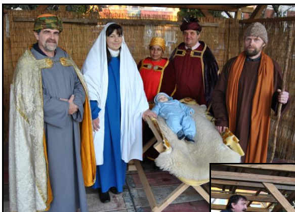
Fryštácká „Svatá rodina“ a tři králové 2017

(Mě osobně hodně mrzí, že se do této akce s více než 10 letou tradicí zapojuje čím dál méně farníků, a přiznám se, že už bych organizaci rád předal někomu mladšímu. Jinak totiž hrozí, že se Fryštácký živý Betlém stane minulostí, na kterou budeme už jen vzpomínat. A také chápu, že v období Vánoc a Tříkrálových sbírek má většina z nás i hlouběji do kapsy – ostatně je to vidět i na vybrané finanční částce, která je rok od roku nižší).