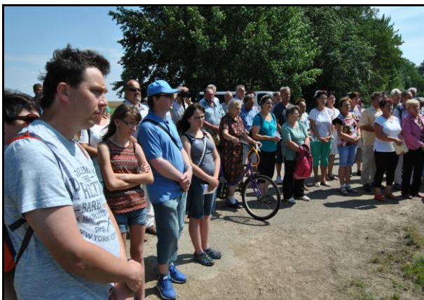
Pobožnost u nově zrekonstruovaného křížku