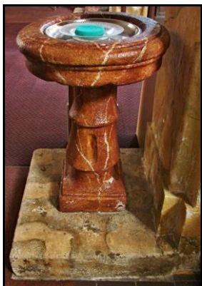
Obnova kamenných prvků v kostele (fotografie z průběhu restaurování)