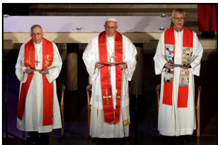
Svatý otec sloužil bohoslužbu s luteránskými duchovními