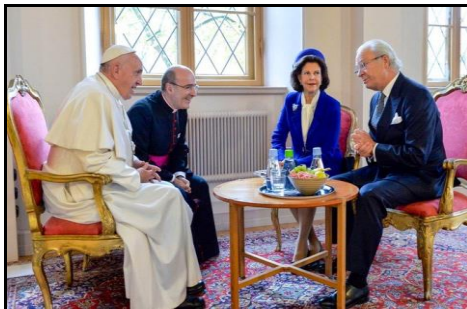
...a sešel se rovněž se švédským královským párem