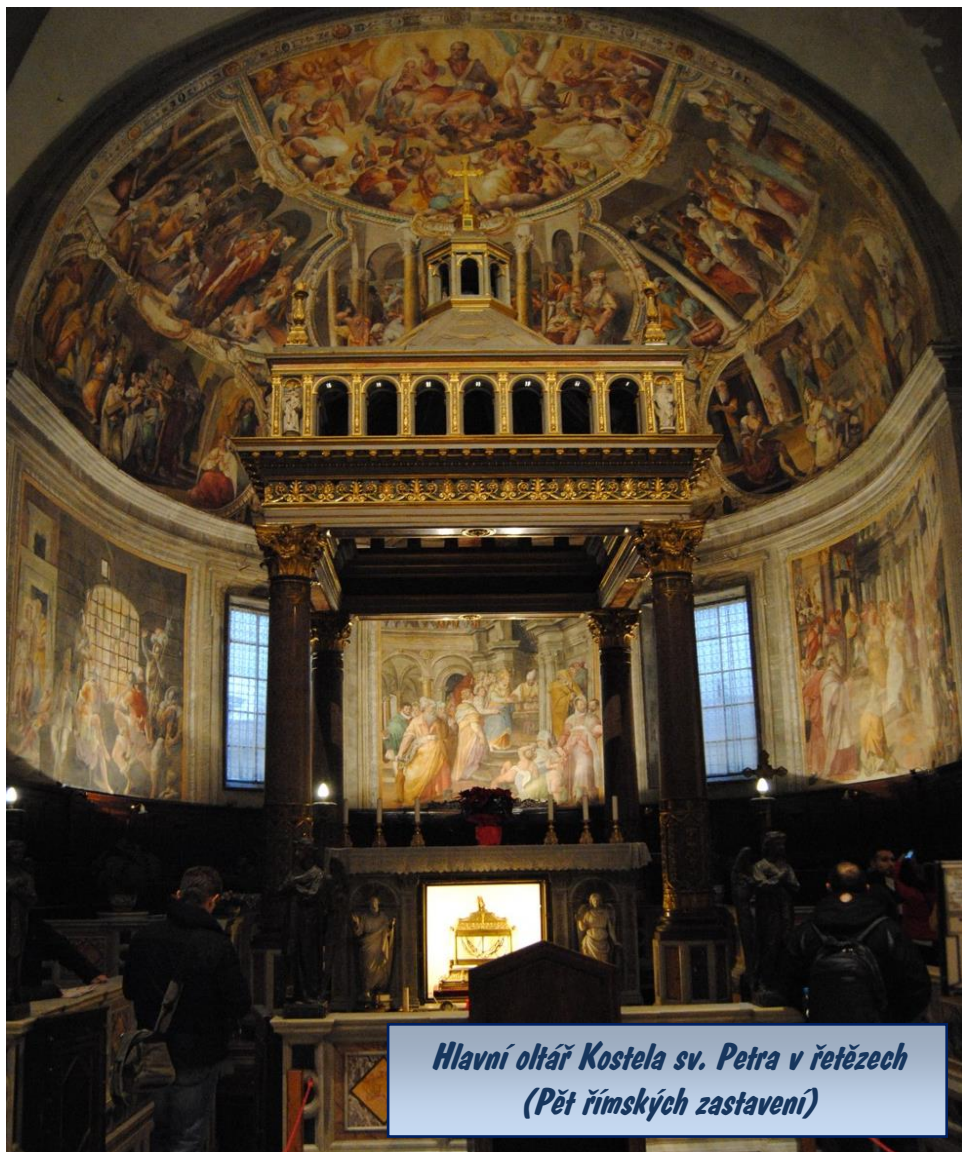
Hlavní oltář Kostela sv. Petra v řetězech (Pět římských zastavení)