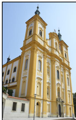
Poutní kostel v Dubu nad Moravou je zasvěcený Očištvání Panny Marie