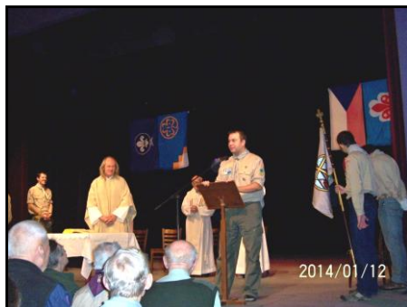
Fryštáčtí skauti v pražském salesiánském divadle v Kobylisích.