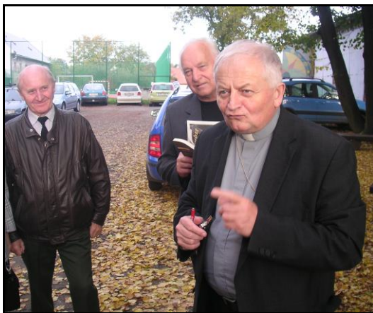
Otec biskup „Kája“ ve Fryštáku

Ani se nechce věřit, že je to už 13 let co do naší farnosti přišel nový kněz. Nikdo si tehdy nedovedl představit, že ve Fryštáku stráví pouze rok a půl. Brzy se tento skromný a nenápadný muž stal oblíbeným a populárním a tak mnozí litovali, že odchází, když byl jmenován pražským biskupem. Dokonce i on sám tehdy mluvil o tom, že by mu ve Fryštáku, jako knězi bylo asi lépe. Ovšem jak praví staré přísloví "Člověk míní a Pán Bůh mění". Dne 19. února 2002 byl jmenován a 6. dubna 2002 ustanoven světícím biskupem pražské římskokatolické arcidiecéze a titulárním biskupem Siccesiánským.