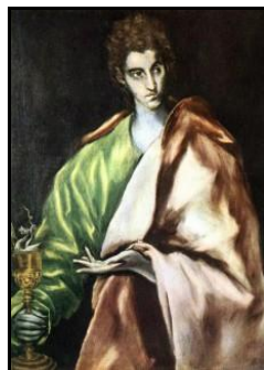
svatý Jan, apoštol