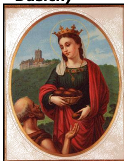
Sv. Alžběta Uherská