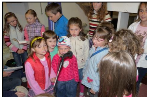
Krojování členové o.s. Rozruch a fryštácká dětská schola