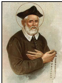
Svatý Filip Neri