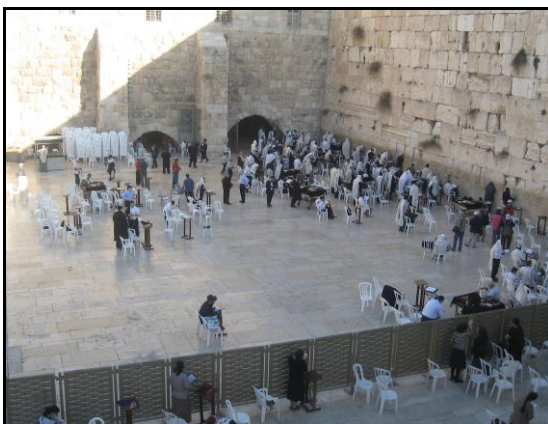
Proslulá „Zed' nářků" v Jeruzalémě a vložené lístky s přáním