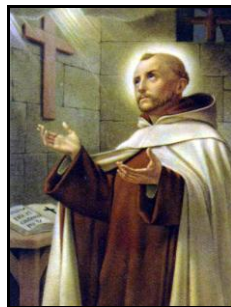
sv. Jan od Kříže