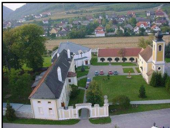
Areál kostela v Paudorfu