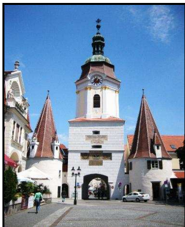
Stará věž v Kremsu