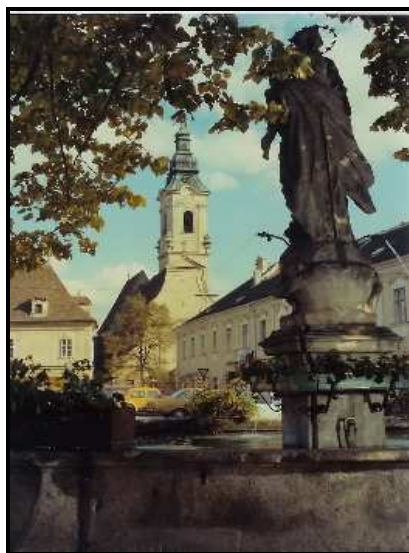
náměstí a kostel Langenlois