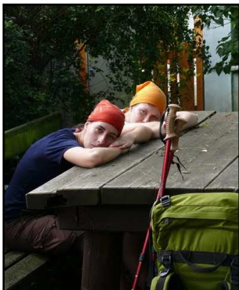
Na cestě nás zmožila únava

Ráno se s námi pan farář rozloučil – dal nám na cestu chleba, nějaké sušenky a obálku, ve které, jak tvrdil, jsou svaté obrázky a povídky k jeho 50. výročí kněžství. Když jsme ale při naší obědové pauze obálku otevřeli, s úžasem jsme vytáhli mimo zmiňovaných věcí několik eur. Vydali jsme se dál vedeni směrkou. Jenže jsme došli pod most u rozvodněné řeky a tam cesta končila. A tak nás místní obyvatelé poslali zpět na místo, kde jsme špatně odbočili – někdo totiž přetočil směrky – napravili jsme tuto chybu a šli dál, tentokrát už dobře. Cestou jsme si vždycky zpívali, modlili se růženec, a tak nám cesta rychleji ubíhala. Šli jsme po takzvané Kamtalradweg. Vedla nás přes krásně upravená městečka podél krásných vinic až do Langenlois. Tam jsme jako obvykle hledali kostel. U kostela jsme shodili bágly a naši krásnou kulhavou chůzí jsme se s Lenkou vydaly hledat faru. Když jsme vešly do dvora, právě proti nám vyšel pan farář. Vysvětlili jsme mu kdo jsme a on na nás začal mluvit česky – byl to totiž Polák. Ubytoval nás ve společenské místnosti, k dispozici jsme měli i kuchyni – no prostě luxus. Zašli jsme opět na mši, pak jsme povečeřeli, milý pan farář nám nabídl i láhev vína (byli jsme přece jen v největší vinařské oblasti Rakouska). ( pokračování příště )