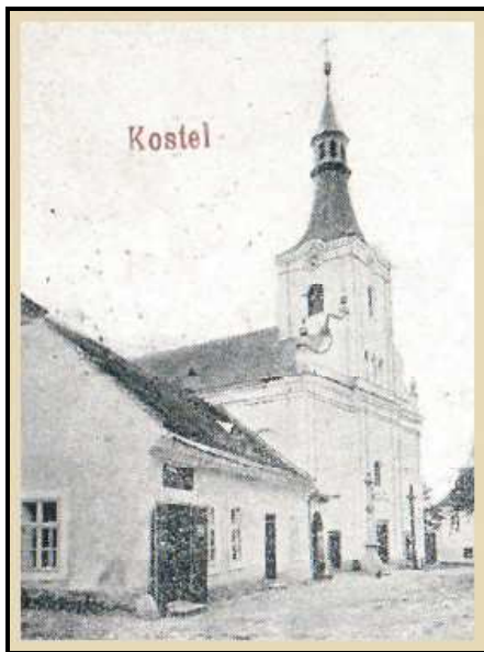
kostel na konci 20. let