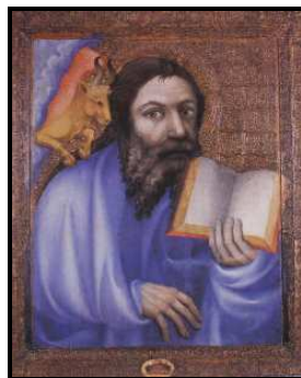
Evangelista svatý Matouš