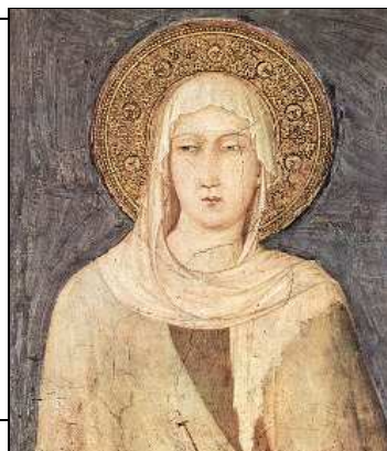
svatá Klára z Assisi