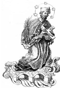
Svatý Jan Nepomucký