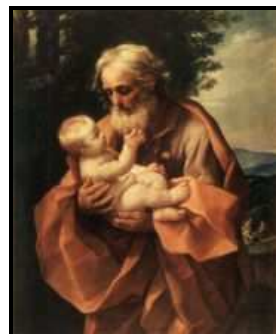
Svatý Josef s Ježíškem