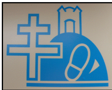
Logo nové poutní cesty

Na projektu spolupracovalo také Arcibiskupství olomoucké.