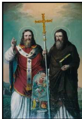
sv. Cyril a Metoděj