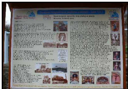
Takto vypadají informační panely

Další informace najdete na internetových stránkách www.maticevelehradska.cz