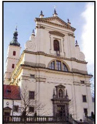
Tyto obrázky jsou z kostela Panny Marie Vítězné v Praze na Malé Straně v Karmelitské ulici.