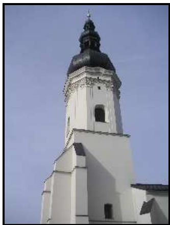
Kostel sv. Václava