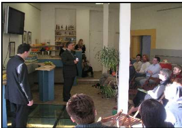
nový konferenční sál TV Noe