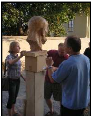
„staříčkovu“ bustu zatím nahradil „tatiček“ Masaryk