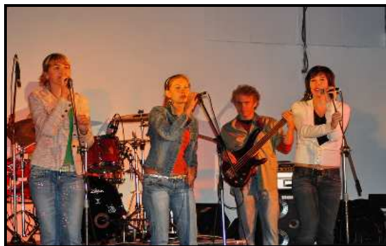
Hraje slovenská skupina Boží šramot