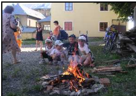
Oheň, oheň, hřeje ruce...au to pálí

Tentokrát byla účast opravdu hojná a myslím, že ten kdo přišel nelitoval....ještě jednou díky všem organizátorům a těm, kdo přispěli ke zdaru této akce – srdečné Pán Bůh zaplať... - pn -