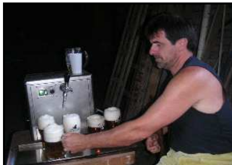
Na čepu je Zlatý Bažant ...