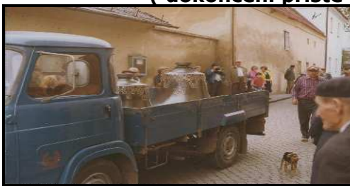
Nové zvony přijely do Fryštáku Se zvonařkou Dytrychovou