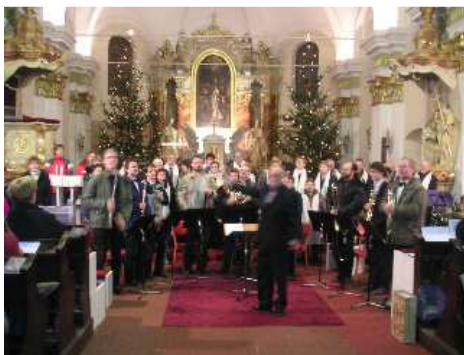
PĚVECKÝ SBOR Z UNIČOVA