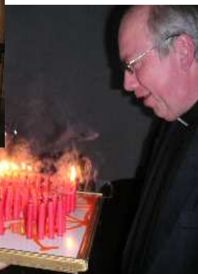
Cóóó, že to nesfouknu naráz ?