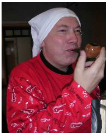
KřemÍREK a fajkou