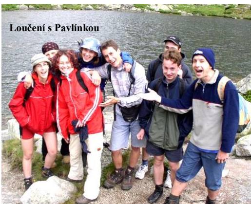
Loučení s Pavlínkou

jme se dočkali odměny v podobě výhledu do všech stran. Cesta dolů byla rychlá, a tak jsme se brzy setkali s Pavlínkou. Tím ale den zdaleka nekončil. Rozhodli jsme se totiž vyzkoušet hru zvanou minigolf. Zpočátku měli někteří s neposlušným míčkem problémy, byli i tací, kteří se vymlouvali na křivou hůl, ale nakonec všichni prokázali své nesporné sportovní kvality. No a ani to nebylo vše. Cestou domů jsme navštívili ještě jednu atrakci – tzv. bobíky – vozítka, řídicí se po dráze závratnou rychlostí (někteří byli z jízdy tak namlsaní, že ignorovali nápis „stop“ a snažili se prorazit kolonu a jet ještě jednou... :-))