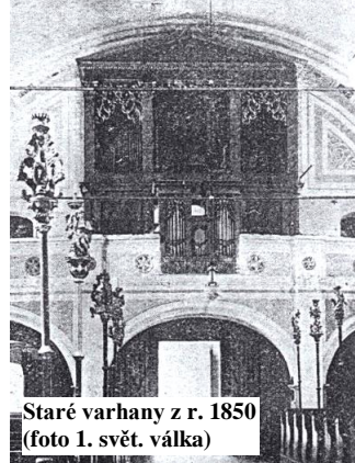
Staré varhany z r. 1850 (foto 1. svět. válka)