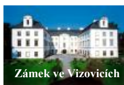
Zámek ve Vizovicích

Nieméně konec komunismu zastihl tuto památku ve Fryštáku. Monstrance byla nadále užívána pouze při největších církevních slavnostech, těsně před rokem 1998 snad už jen jednou nebo dvakrát za rok. V roce 1998 fryštická farnost zapůjčila tuto vzácnou památku na výstavu s názvem: „Od Gotiky k renesanci. Výtvarná kultura Moravy a Slezska 1400 – 1550“, což byla největší výstava středověkého umění, která se kdy v českých zemích konala (probíhala od podzimu 1999 do 27. února 2000). Celá expozice se skládala ze tří výstav – v Brně, Olomouci a Opavě, přičemž jenom výstavou v Olomouci (v Muzeu umění), kde byla vystavena naše monstrance, prošlo přes 21 000 návštěvníků. (Monstrance z Fryštáku byla na této výstavě pojištěna na 1 500 000 Kč). Kvůli větší bezpečnosti byla naše gotická monstrance po skončení výstavy ponechána ve střeženém trezorovém depozitáři v Olomouckém arcibiskupství. Do Fryštáku přijela naposledy v loňském roce jen na několik dnů, na zdokumentování, ohodnocení a zanesení do nového inventáře fryštické farnosti. Její cena byla odhadnuta na 2 000 000 Kč. V nedávné době přišla z Olomouce žádost o propůjčení monstrance pro stálou expozici církevních uměleckých předmětů právě v Olomouci, s čímž náš otec Emil samozřejmě souhlasil. Jinak se do budoucna počítá s celkovou odbornou restaurací celé této památky.